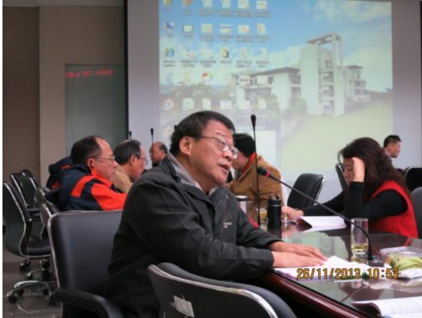
陳榮譽觀護人芳文輔導個案經驗分享