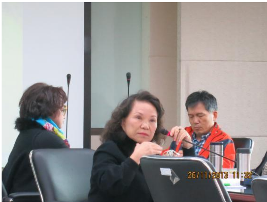
藍榮譽觀護人莉齡輔導個案經驗分享