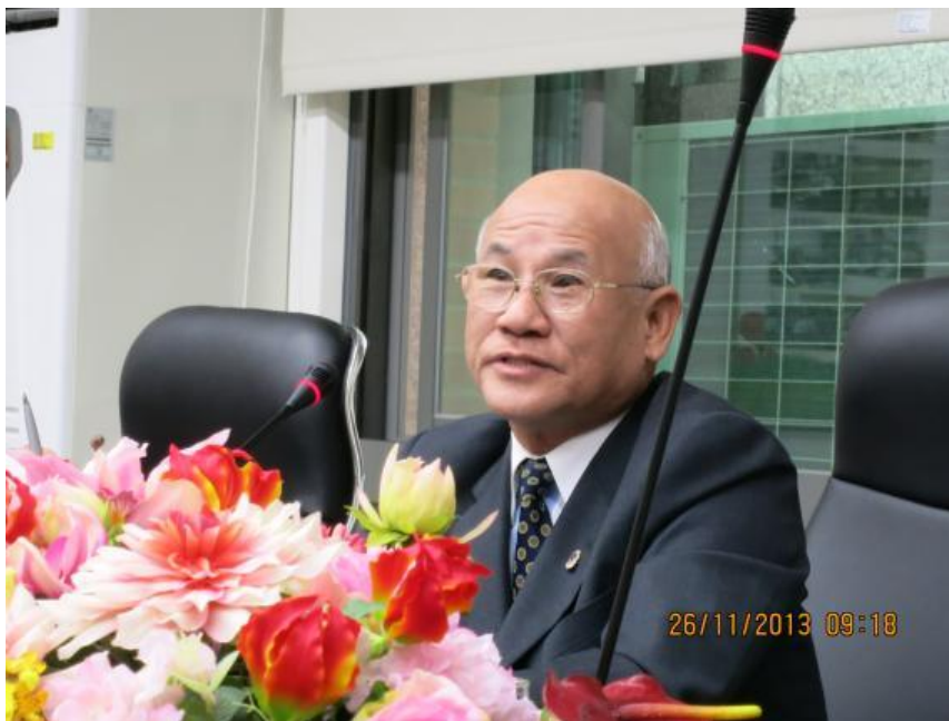
簡榮譽觀護人華揚擔任訓練課程主講人