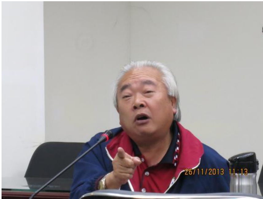
李榮譽觀護人國錦輔導個案經驗分享