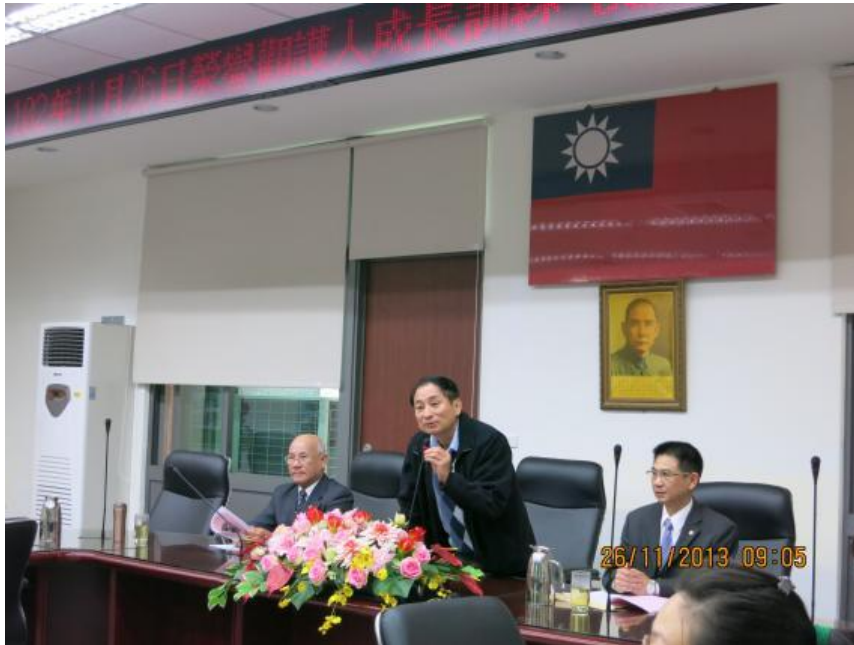
賴執行檢察官慶祥給予榮譽觀護人肯定與勉勵