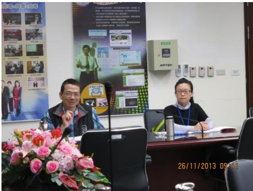
黃主任觀護人金島給予榮譽觀護人肯定與勉勵