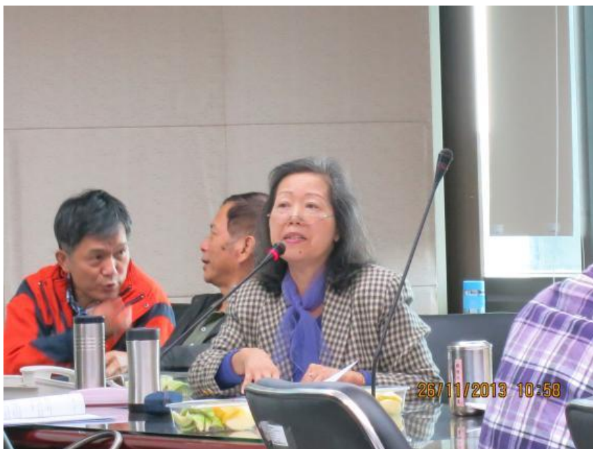
戴榮譽觀護人鳳姿輔導個案經驗分享