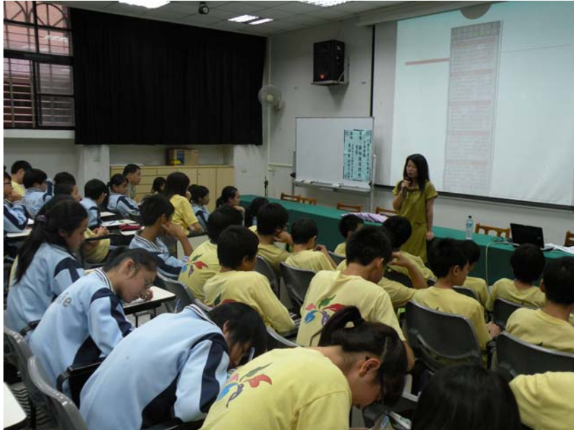
更生保護會黃副執行秘書至五結國中宣導情形