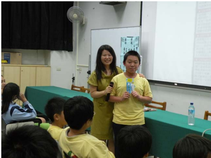
贈送宣導品予同學