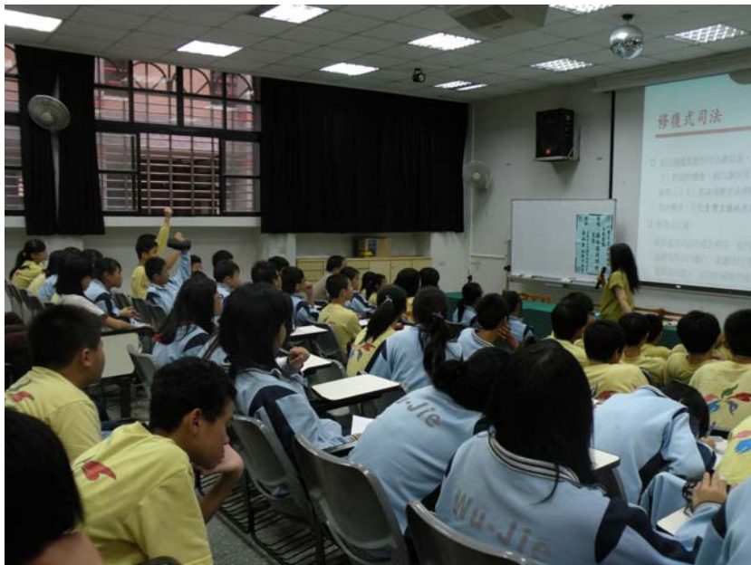
更生保護會黃副執行秘書至五結國中宣導情形