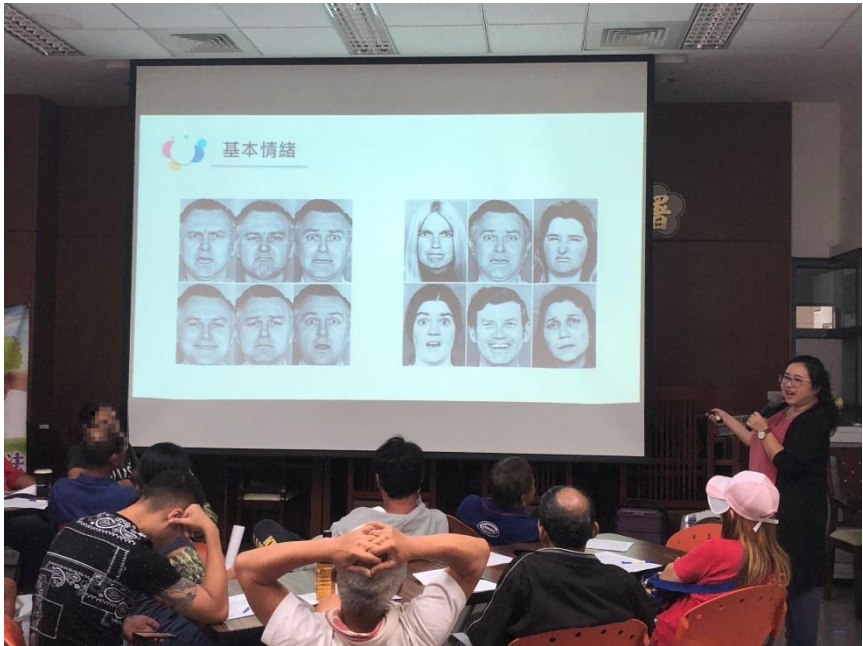
辦理宣導單位：臺灣宜蘭地方檢察署