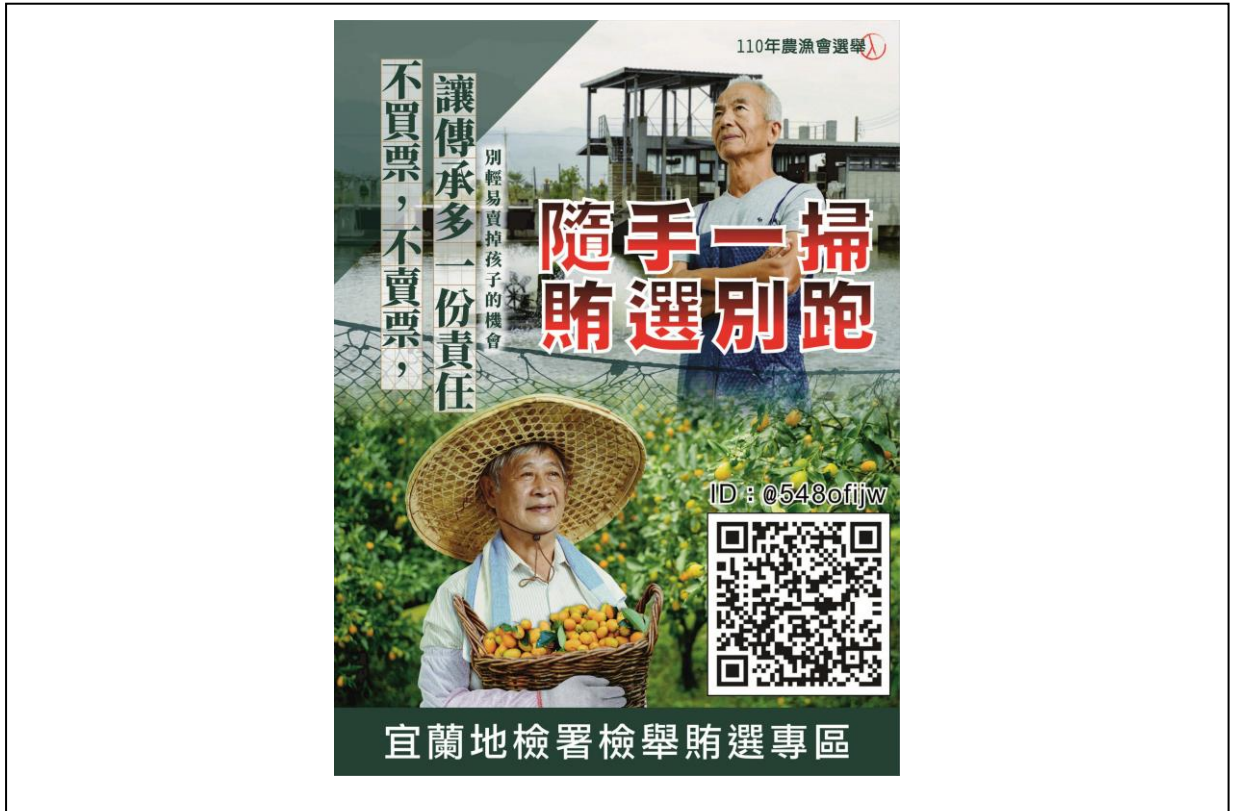
本署反賄選海報及「隨手一掃、賄選別跑」QR Code