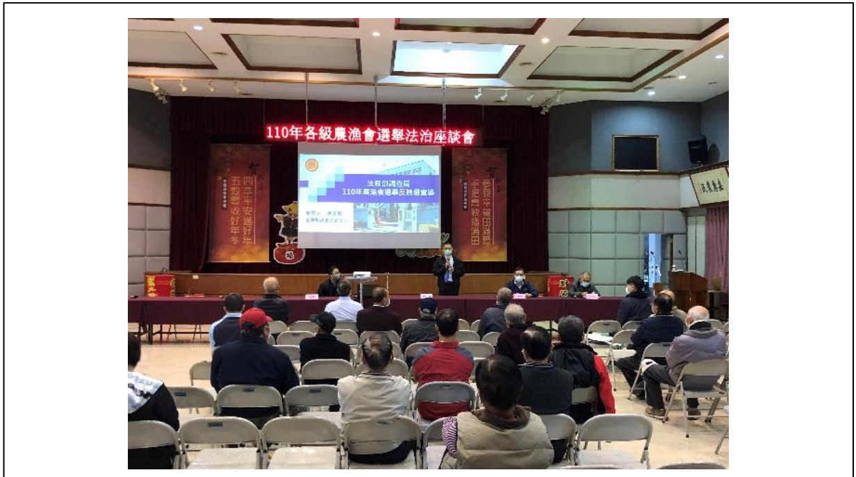
本署主任檢察官率同警調機關至五結鄉農會舉辦選舉法治座談