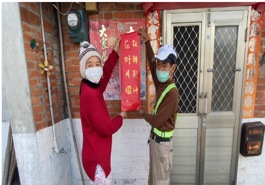
貼上春聯迎接新年