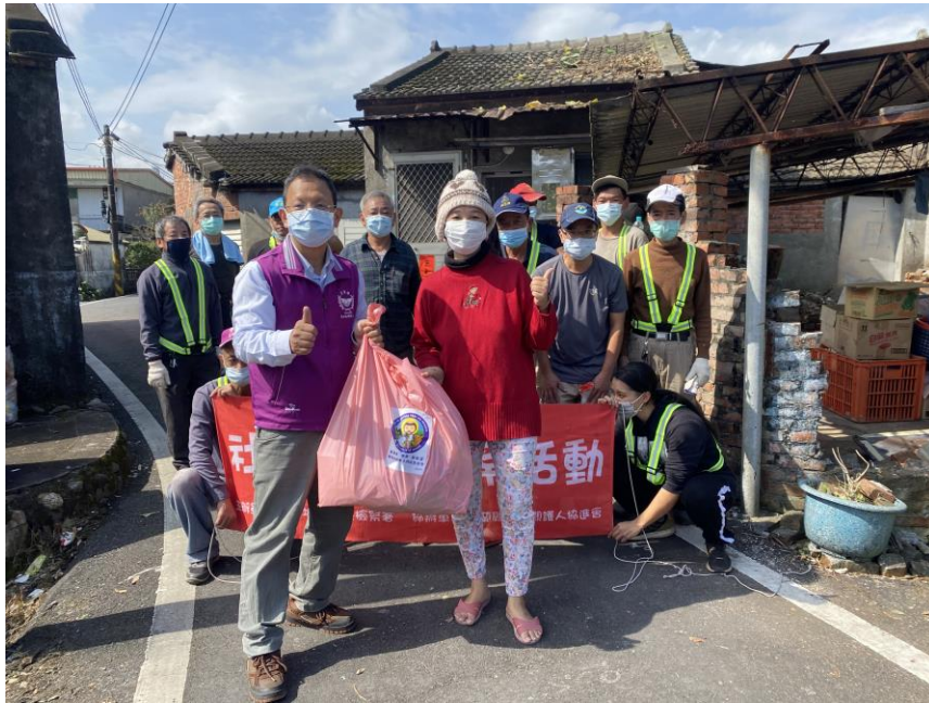
愛加倍關懷協會致贈物資