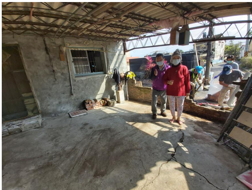
打掃後的環境清爽無比