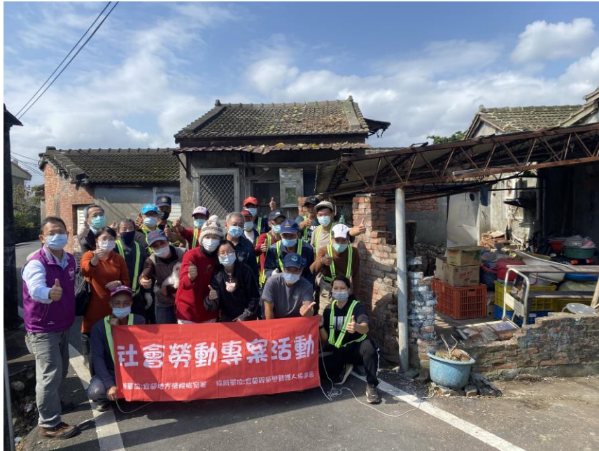
工作完成後的大合照