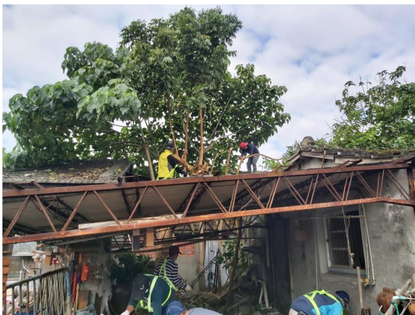
開始進行大樹清除工作