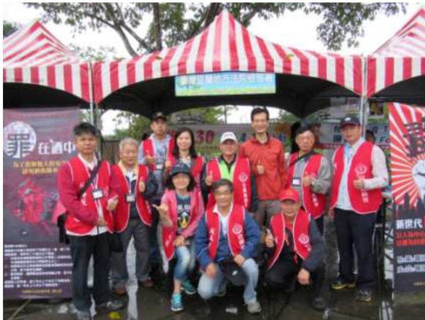
本署洪觀護人生輝及榮譽觀護人合影留念