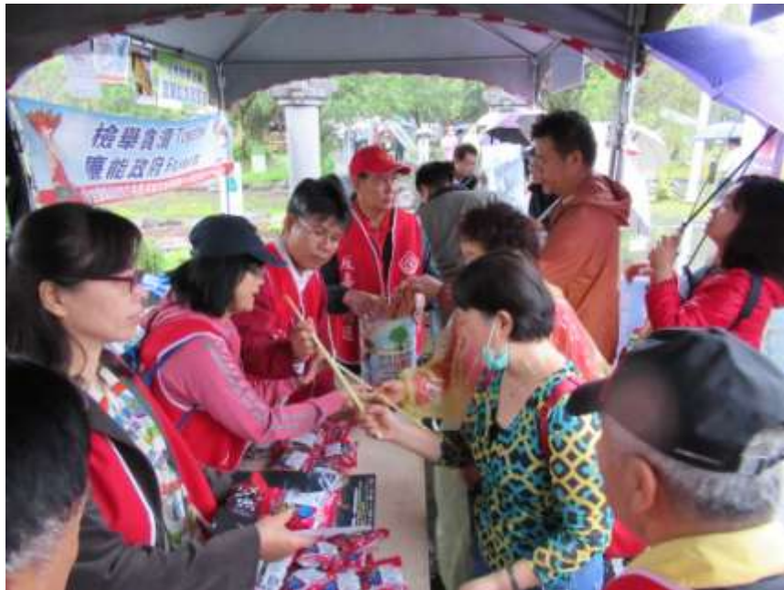
本署洪觀護人生輝及榮譽觀護人向民眾宣導法治概念