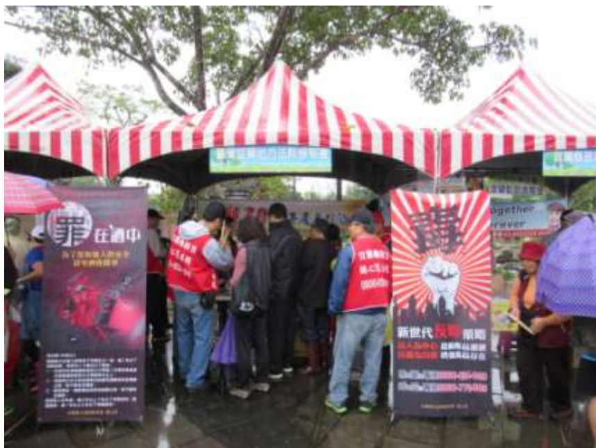
本署洪觀護人生輝及榮譽觀護人向民眾宣導法治概念